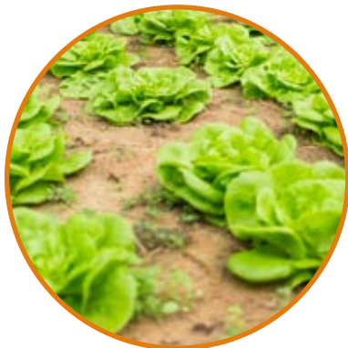
Riego para cultivo, huerto