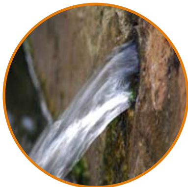
Pozos y aljibes