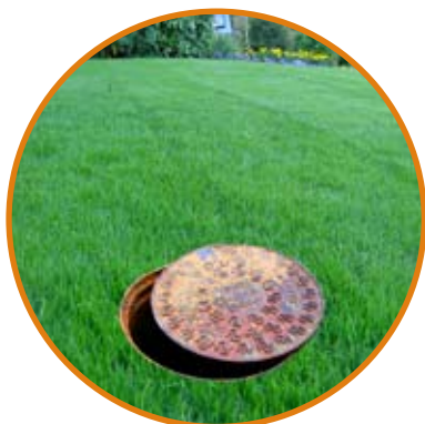
Achique fosas sépticas